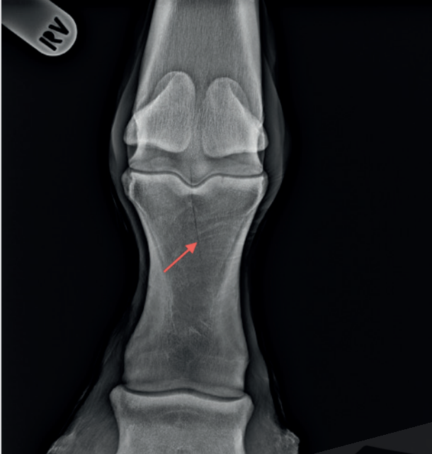
Abbildung 10-05: Fissur