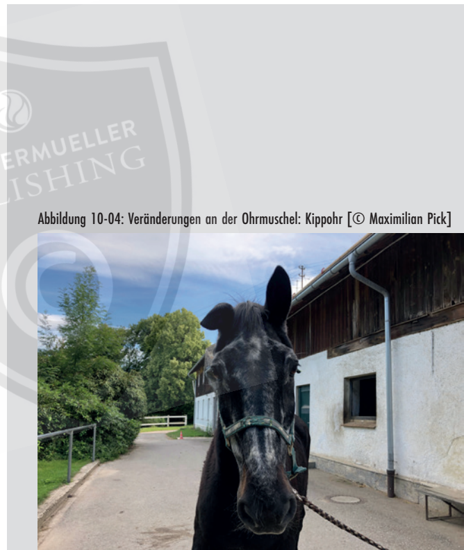
Abbildung 10-04: Veränderungen an der Ohrmuschel: Kippohr

Für orthopädische Erkrankungen bei denen Röntgenaufnahmen zugrunde gelegt werden, kann der Röntgenleitfaden 2018 zur Beurteilung der Wertminderung nur bei Ankaufuntersuchungen und bei einem lahmfreien warmblütigen Reitpferd ab einem Alter von 3 Jahren herangezogen werden. Für Krankheiten, bei denen der Röntgenbefund mit dem Begriff Risiko verbunden sind,